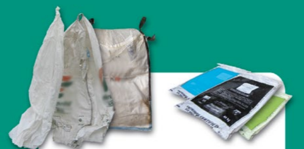
Engrais, amendements, et semences