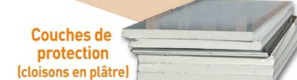
Couches de protection (cloisons en plâtre)