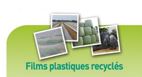
Films plastiques recyclés