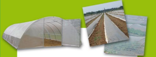
Couvertures de serres