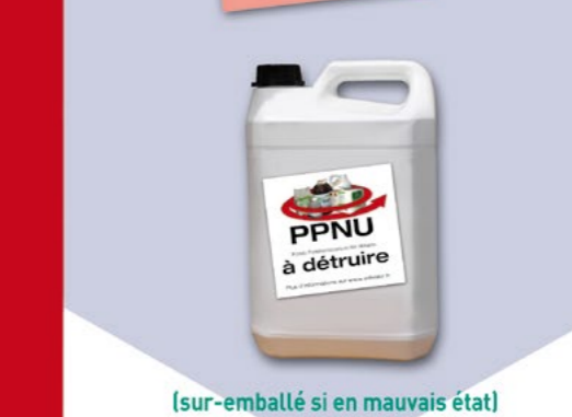
(sur-emballé si en mauvais état) avec mention "à détruire"