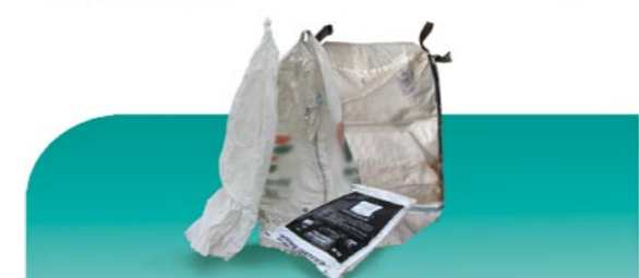
Big bags recyclés