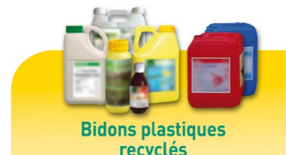
Bidons plastiques recyclés

EXEMPLE Avec 100 kg de films plastiques on fabrique 650 sacs poubelles de 100 litres