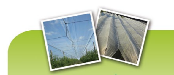
Filets paragrêle recyclés