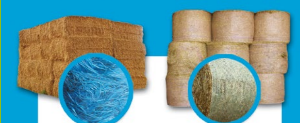
Conditionnement des fourrages, palissage vigne et horticulture