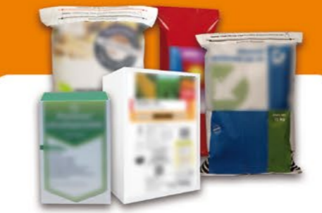
Produits phytopharmaceutiques et fertilisants