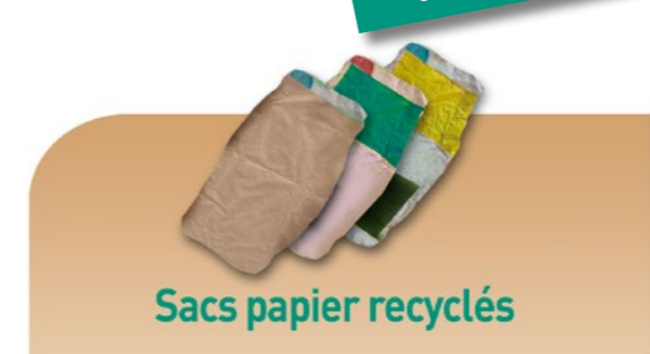
Sacs papier recyclés