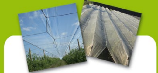
Protection des cultures arboricoles