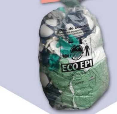
à déposer chez les distributeurs, partenaires "ECO EPI", lors des collectes de PPNU.