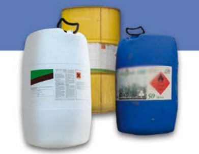
Produits phytopharmaceutiques et fertilisants