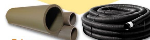
Tubes pour l'industrie Gaines techniques