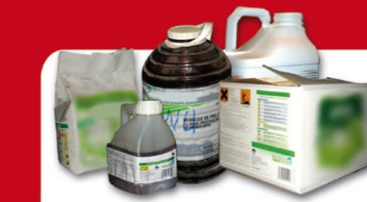
Produits Phytopharmaceutiques Non Utilisables