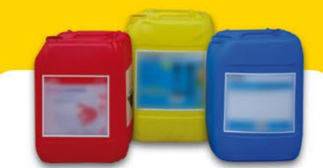
Produits d'hygiène de l'élevage laitier