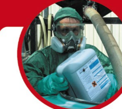
Equipements de protection individuelle chimique