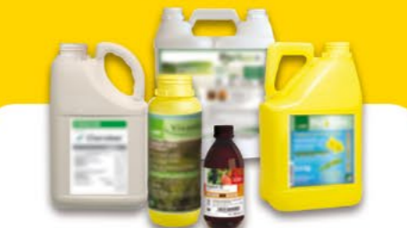
Produits phytopharmaceutiques et fertilisants