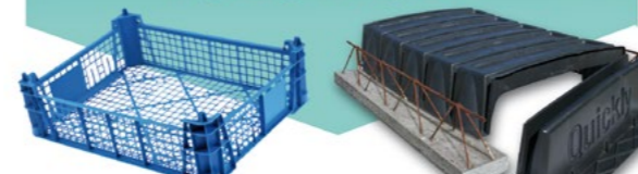
Cagettes plastiques Éléments de construction